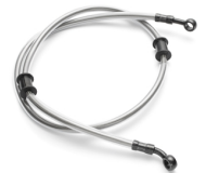
Hadice přední brzdy s opletením z nerezové oceli pro model XV950

For all XV950R accessories go to the website, or check your local dealer