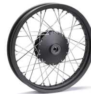
Zakázková paprsková kola pro model XV950